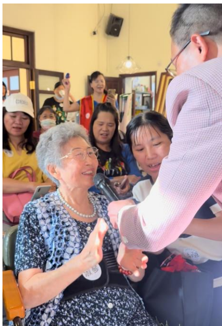
圖說四：85歲的何奶奶同時也是合庫人壽保戶，合庫人壽有提供免費的「彈性喘息」服務，所以她申請居服員陪她來與大家一起同樂。