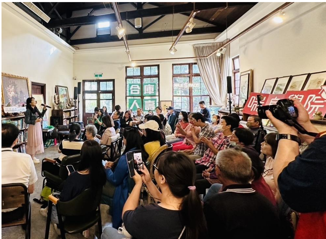
圖說三：歌手周子寒與照顧者一同歡唱民歌，讓家庭照顧者暫時放下照顧壓力，回顧自我的青春年華。