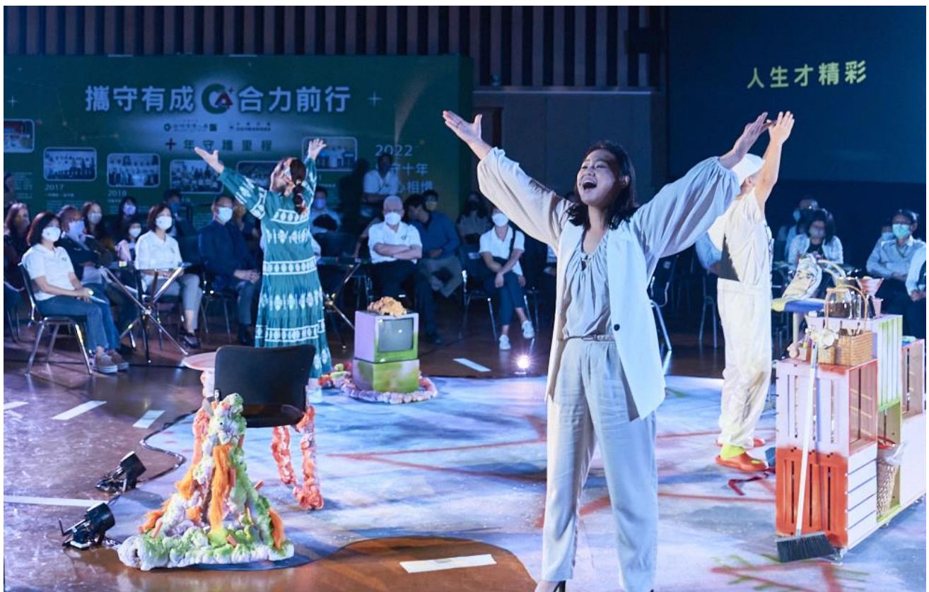
圖二 國內首齣關懷家庭照顧沉浸式音樂劇，《哈囉!呼叫星隊友》帶給觀眾一個溫暖的夜晚。