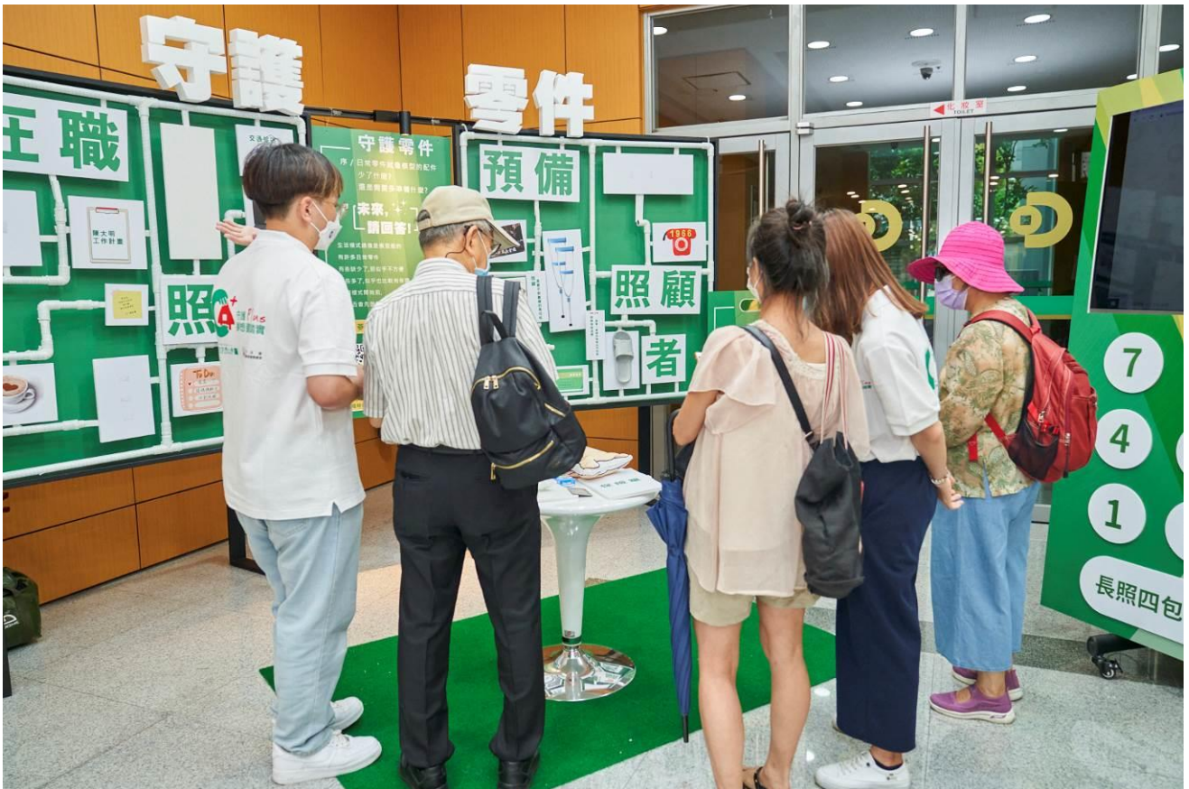
圖三 音樂劇場外同時可體驗生活策展，透過互動讓民眾更認識長照議題。

除了沉浸式音樂劇以外，同場加映的未來請回答生活策展則以實體情境結合線上「人蔘養成」任務，可在線上回答照顧時會碰到的練習題，現場同時亦陳列多項照顧資源增進現場參加者對此一議題的了解。合庫人壽董事長杜振遠也提醒，在照顧家人這條路上一定要及早認識長照資源並做好自身規劃，像在职照顧者要一邊上班一邊照顧重病家人，時間、體力、財力都有限的狀況下，一定要好好運用長照資源並儲備好自身未來規劃，才能讓自己照顧家庭及生活遊刃有餘，創造生命各種可能性。